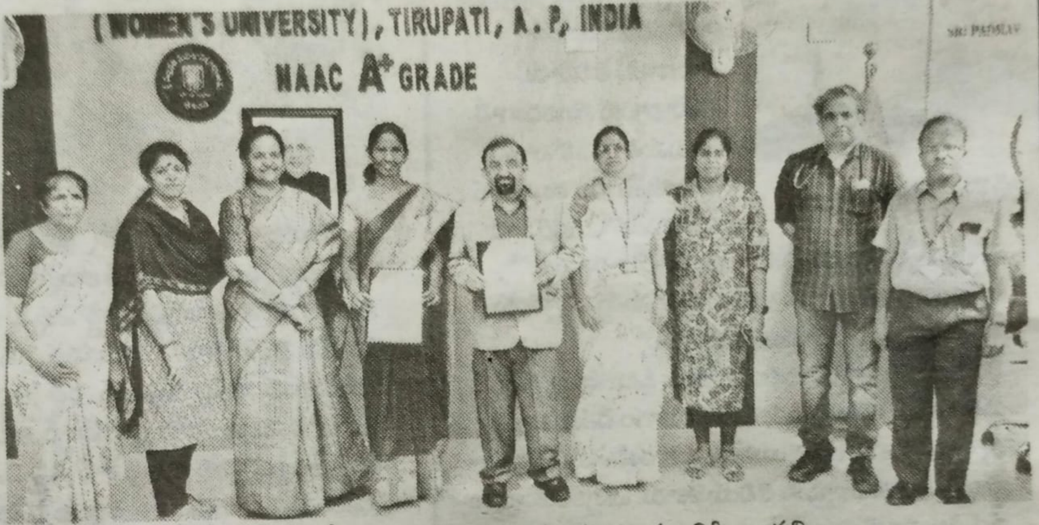
స్విమ్సో ఒప్పందం కుదుర్చుకుంటున్న విసి భారతి